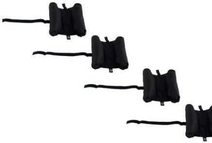
L45474 | Beschwerer-Set