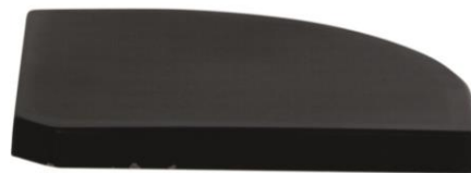
M31938 | QUADRO LIGHT 2er Set à 18 kg