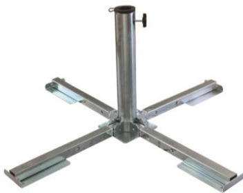
J01225 | STAHLKREUZ klappbar