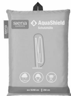
D41184 | AQUASHIELD Schutzhülle