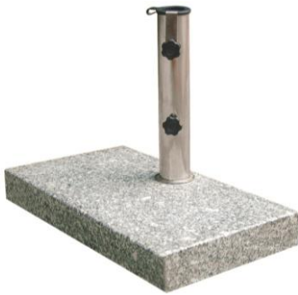
213345 GRANIT 25 kg Balkenschirmständer