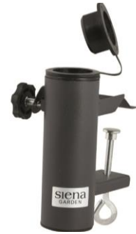
L30528 | BALKONSCHIRMKLAMMER