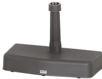
J40985 | BETON 20 kg Kunststoff anthrazit