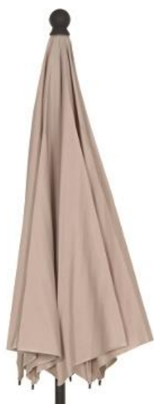
Schirm | parasol

Please check the parts for completeness and integrity.