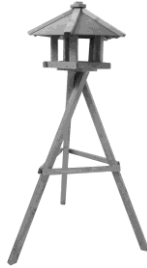
P06847 Vogelhaus PEPE