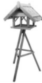
P06860 Vogelhaus ERIK