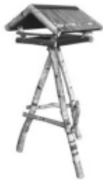
J34264 Vogelhaus EMIL